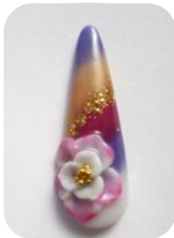
N/NDS1, 3, 4 N/NDS5, 8 HS1