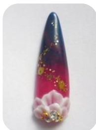
N/NDS1, 3, 9 HG1