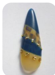
N/NDS5, 9, 10