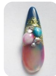
N/NDS1, 3, 4 N/NDS5, 9, 10